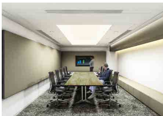
会議室エリア (CALDAMOMUNルーム)