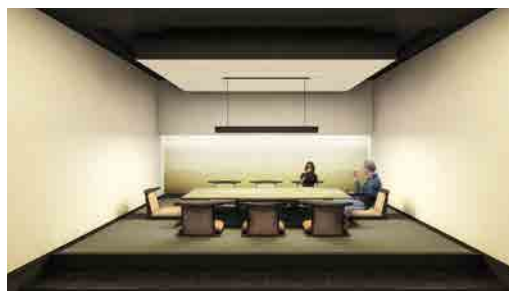
会議室エリア (WASABIAルーム)

オフィスサポートフロアに配置された貸会議室エリアは、「Season」の派生語である「Seasoning = 調味料」から連想した「Spice」をエリア名とし、オフィスワーカーを刺激するようなスパイス名を18種類選び、展開しています。たとえば、和室の会議室は「WASABIA」とネーミングし、空間にもワサビにちなんだ壁紙やファブリックを使用しています。