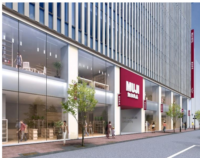
「マロニエ×並木 読売銀座プロジェクト」(イメージ) 左：並木通りより(外観) 右：並木通りより(低層)